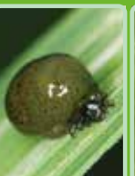
イネドロオイムシ