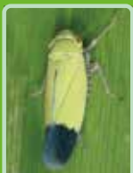
ツマグロヨコバイ